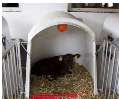
Figure 1 : Igloo avec ventilateur intégré.

En plus des possibilités d'ombrage, il existe des ventilateurs qui peuvent être montés à l'intérieur des igloos.