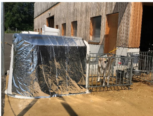
Figure 2 : Igloo avec page de couverture

Les bâches pour les igloos à veaux sont disponibles dans le commerce. La bâche testée par le Strickhof est placée sur l'igloo et fixée à l'aide de vis et de disques en caoutchouc. Selon le type d'igloo, les vis sont un peu plus longues que l'épaisseur de l'igloo, mais elles ne doivent pas dépasser à l'intérieur de l'igloo, sinon il y a un risque de blessure pour les veaux.