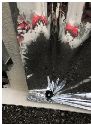
Figure 3 : Fixation du film à l'igloo